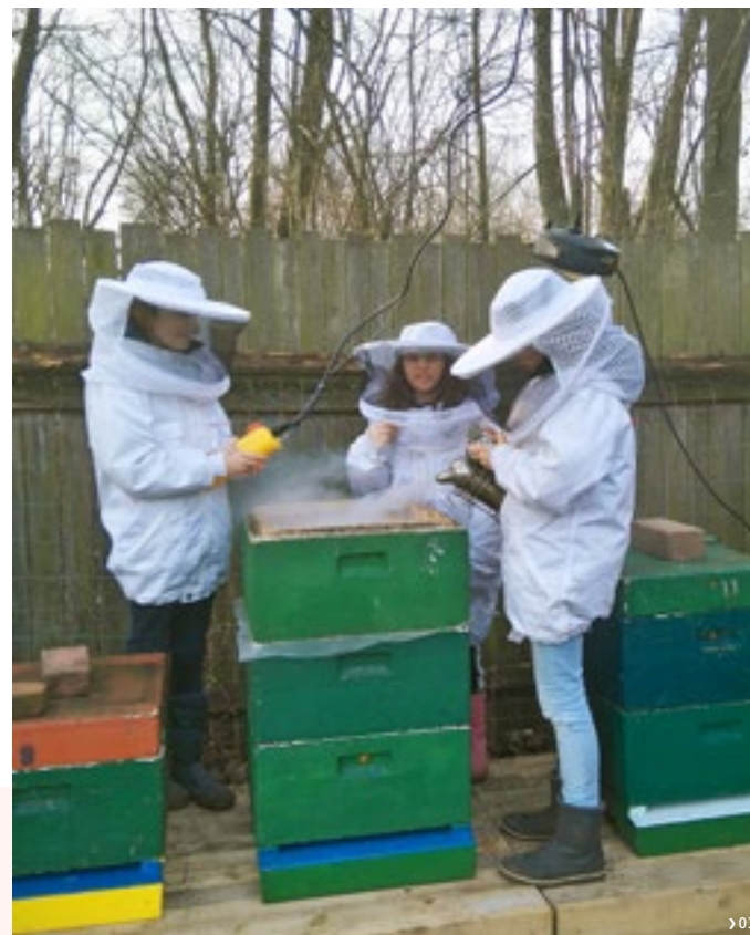
Die Imkerei ist ein elementarer Bestandteil der Kinder- und Jugendfarm.

Es geht unter anderem darum, Kindern die Bedeutung der Bestäubungsinsekten zu veranschaulichen und Zusammenhänge zwischen Agrarprodukt und Biene erfahrbar zu machen. Außerdem ist es uns ein großes Anliegen, nachhaltiges Denken und Handeln zu fördern. Basiswissen für die Führung von Bienenvölkern vermitteln wir natürlich auch.