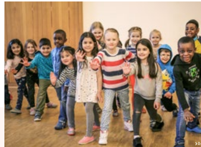
Kulturelle und nationale Unterschiede spielen beim Projekt ›Wir sind Bruder und Schwester‹ keine Rolle.